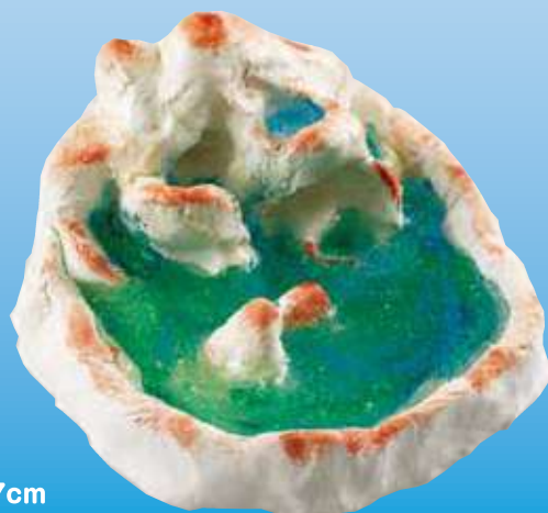
直径 11× 高さ 7cm

※作品の焦げ目などは水彩絵具で着色しています。 ※すべての作品はフォルモ-S1個で制作しています。