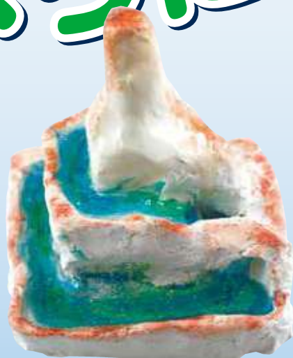
縦 9× 横 9× 高さ 11cm