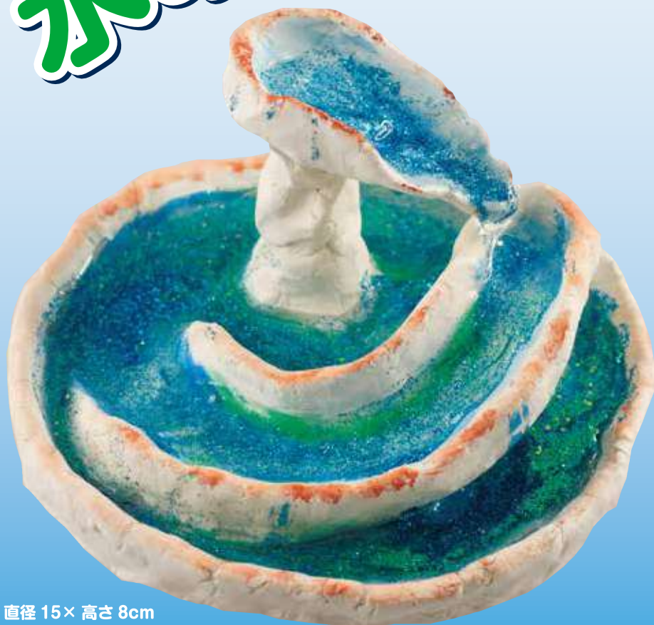
直径 15× 高さ 8cm