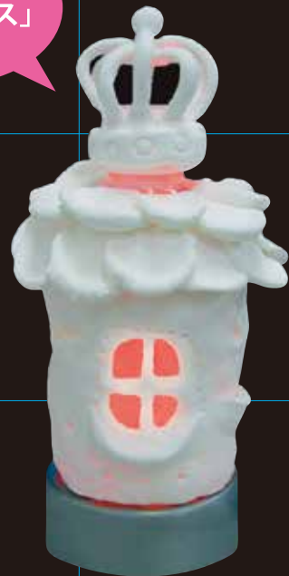
ペットボトルとスーパーカルモ作品