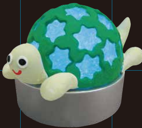
カプセルとスーパーカルモ作品