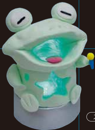
スーパーカルモ作品