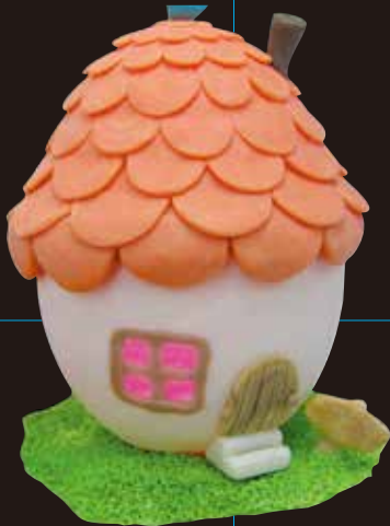
スクールモデナ作品