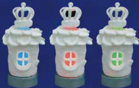
窓や王冠の光がカラフルに変化!