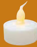
LEDキャンドル (テスト電池付き)