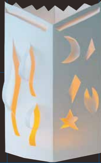
ホワイトペーパーランプ (画用紙作品)