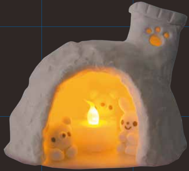
森のかまくら物語 (スーパーカルモ作品)