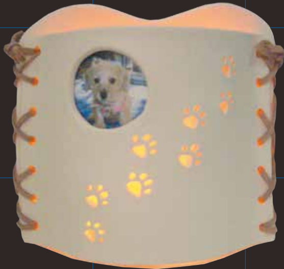
ワンちゃんの足型ランプ (フォルモ作品/革ひも使用)