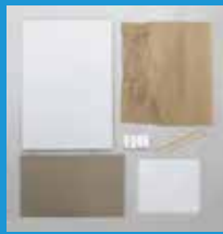
リキッドねんど芯材セット