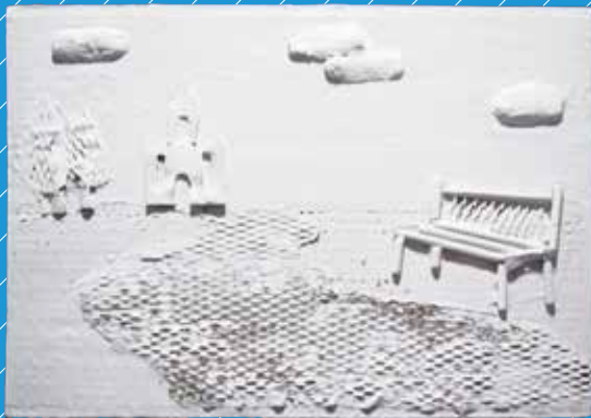
「お城へ続く一本道」