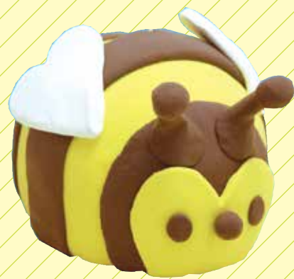
はち スーパーカルモ4色セット