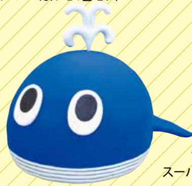
くじらくん スーパーカルモ-S