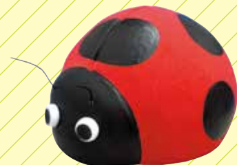
てんとう虫 スーパーカルモ4色セット