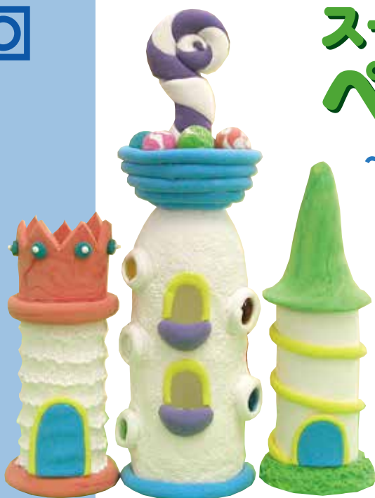
魔法使いのお城(スーパーカルモ-L・4色セット 各1個)