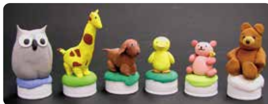
小さな粘土のどうぶつたち(スーパーカルモ4色セット) → 余った粘土でもつくれます。