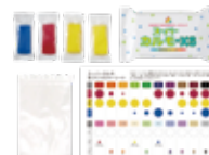
スーパーカルモ4色セット