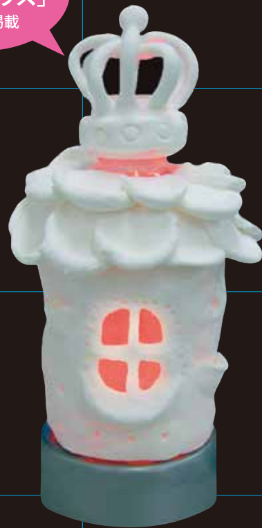
ペットボトルとスーパーカルモ作品