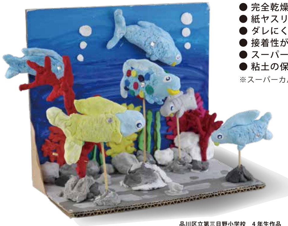
品川区立第三日野小学校 4年生作品 カラー粘土はスーパーカルモミニ3色セットを併用