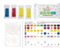
スーパーカルモ4色セット