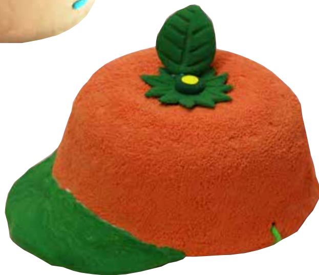
オレンジキャップ(スーパーカルモミニ3色セット・スーパーカルモ50g 各1個)