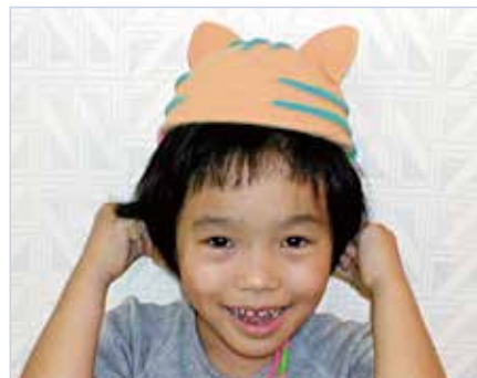
ネコのぼうし (スーパーカルモ-S・ミニ3色セット 各1個)