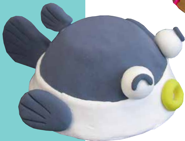
フグのぼうし(スーパーカルモ-S・スーパーカルモミニ3色セット 各1個)