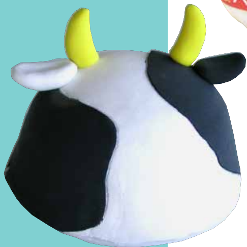
牛のぼうし(スーパーカルモ-S 1個、絵具)