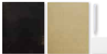
アルカラーシート 黒×銀 コード: 101485