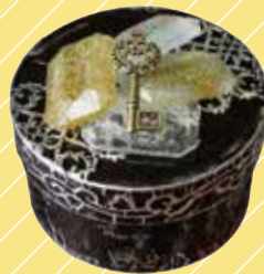
石粉粘土や土粘土 軽量粘土作品にも