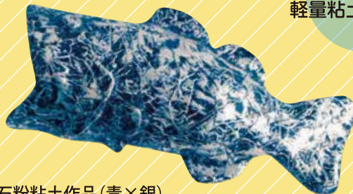
石粉粘土作品(青×銀)