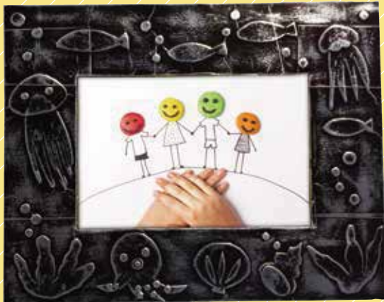
メタルフォトフレーム(黒×銀)