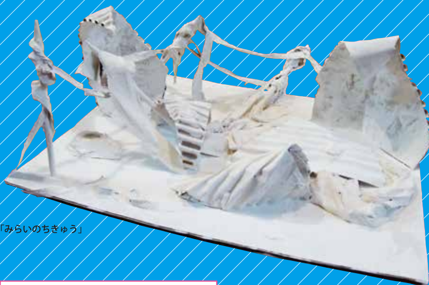
「みらいのちきゅう」