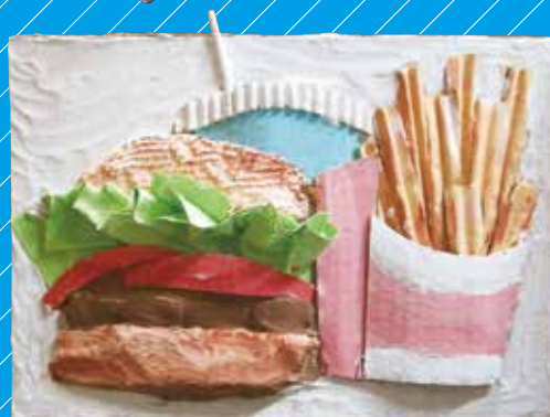
「ハンバーガーをめしあがれ」 ※この作品は絵具を使用しています。

布やダンボール、紙、木など 色々な材料で作品が作れる リキッドねんど用芯材セット