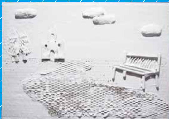
「お城へ続く一本道」