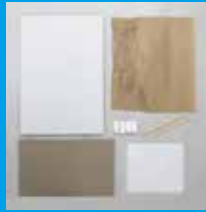
リキッドねんど芯材セット