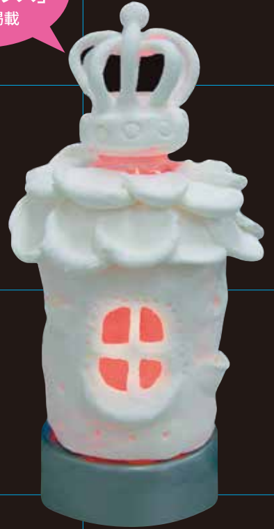
ペットボトルとスーパーカルモ作品