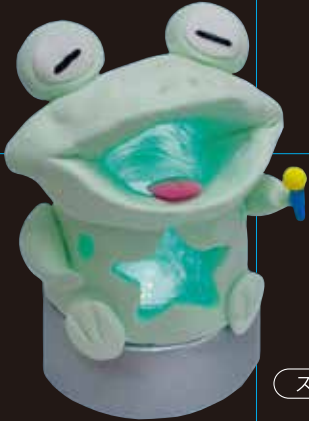
スーパーカルモ作品