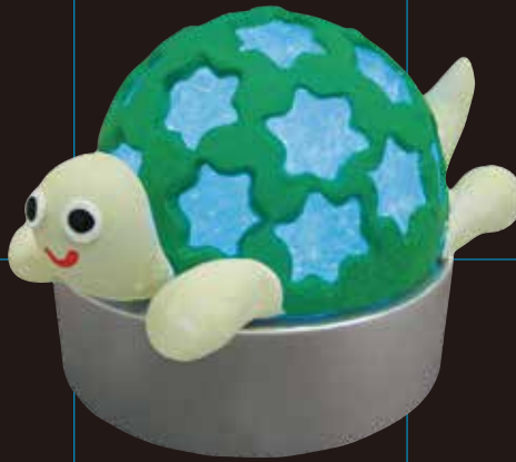
カプセルとスーパーカルモ作品