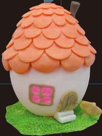
スクールモデナ作品