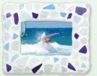
フォトフレーム作品